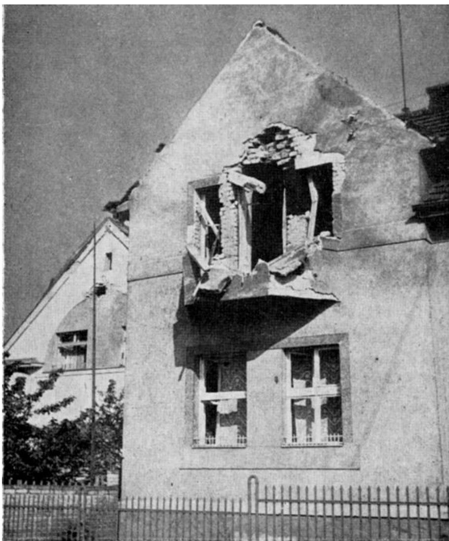
Za bojů poškozený dům v Radotíně