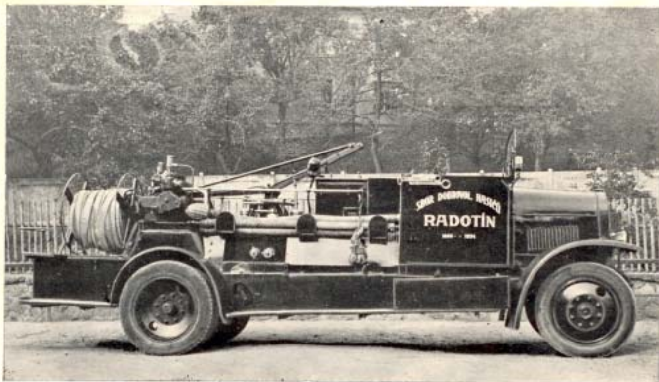
Motor. stříkačka z r. 1922 přemístěná pílí členů v r. 1934 na automob. podvozek.