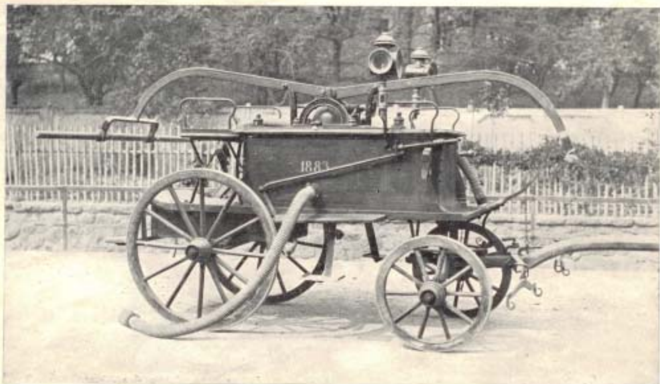
Stříkačka zakoupená obcí v roce 1883.