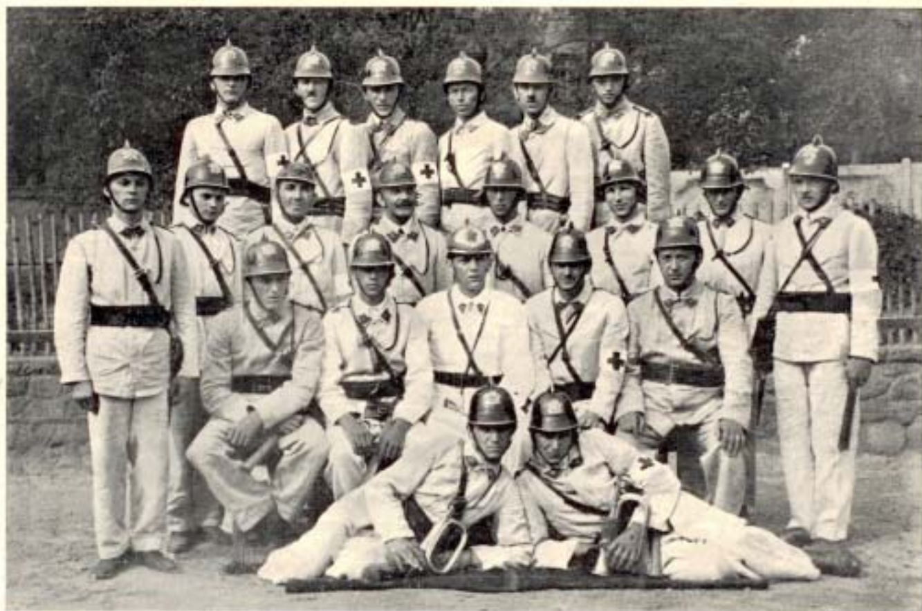
Členové činní v jubilejním roce 1936.