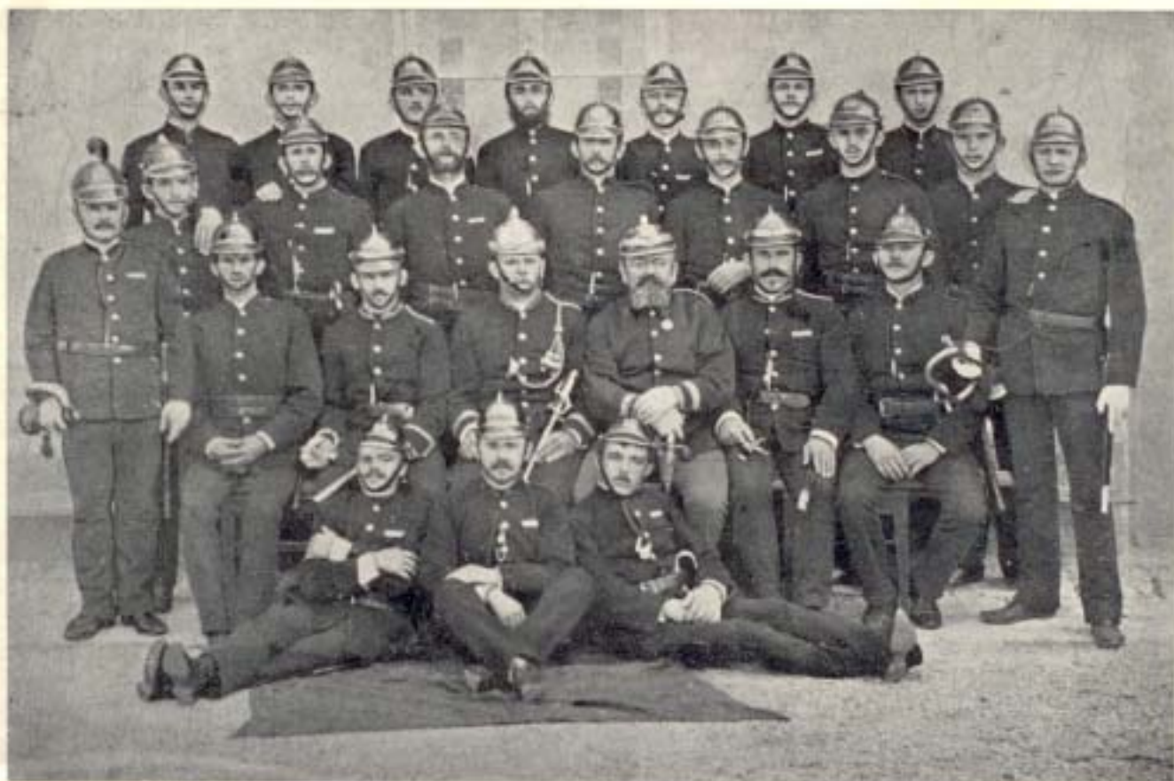
Členové činní 4 roky po založení sboru.