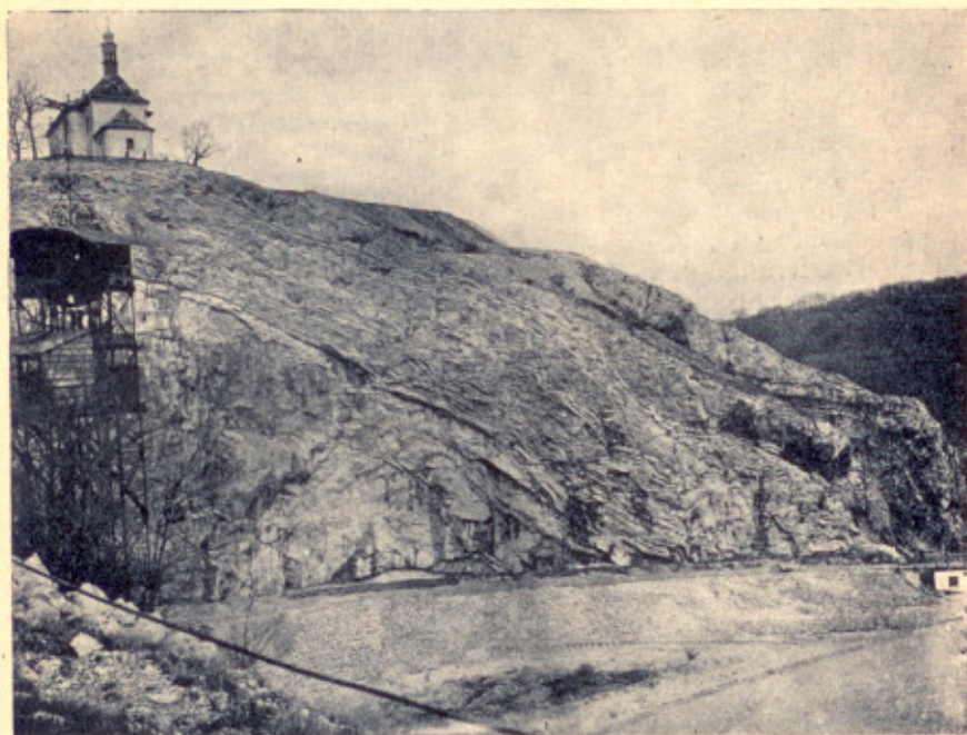
Obr. 3. Stěna lomu pod kostelíkem sv. Prokopa. Vlevo dole masivní útesové vápence prokopské, nad nimi deskovité vápence bez rohoveců a na okraji (zvrásněné) vápence zlíčovské s rohoveci a korálovým útesem (na hranici s předešlými). (Pohled od kříže nad restaurací.)

vrstvami. Při pohledu do vltavského údolí, jednak směrem ke Zbraslavi, jednak směrem k Pankráci a ke Praze povšimněme si nápadných stupňů rozkládajících se na pravé straně vltavského údolí, a pokrytých rozsáhlými uloženinami říčních štěrků; jsou to nánosy diluviální Vltavy. Jednotlivé st u p n ě č i l i t e r a s y (celkem tři) naznačují nám úrovně, ve kterých Vltava kdysi tekla.