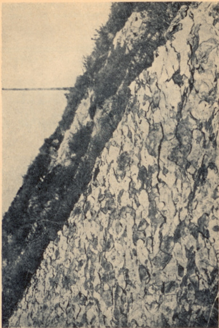
Obr. 1. Hlíznaté vápence zlíčovské (rohovcové hlízy). Z cesty od konečné stanice elektrické dráhy č. 5 k dráze buštěhradské.