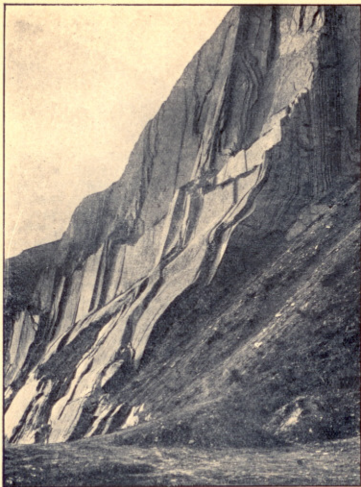
Obr. 5. Flexurovitý ohyb vápenců hlubočepských v lomu u jezírka v Hlubočepích.

lejským, a za ní zvedajících se vápenců bránických, které odtud pokračují na výšinu Dívčích hradů nad Smíchovem. Tato morfologie jest pěknou ukázkou vlivu nestejně odolnosti různých hornin vůči větrání.