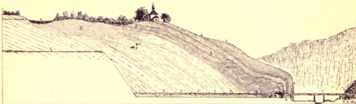
Geologický profil prof. dr. Kettnera vápencovým lomem u svatého Prokopa. 1. = šedé hlíznaté vápence; 2. = masivní útesové vápence prokopské; 2'. = šedé deskovité vápence, přecházející do vápenců útesových; 3. = šedé deskovité vápence silně zvrásněné; 4. = korálový horizont; 5. = vápence zlichovské (s rohovci); 6. = třetihorní pisky; j. = zbytky svatoprokopské jeskyně.