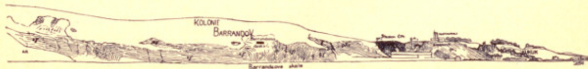
Geologický profil Barrandevou skalou (viz stratigrafická tabulka na str. 16).