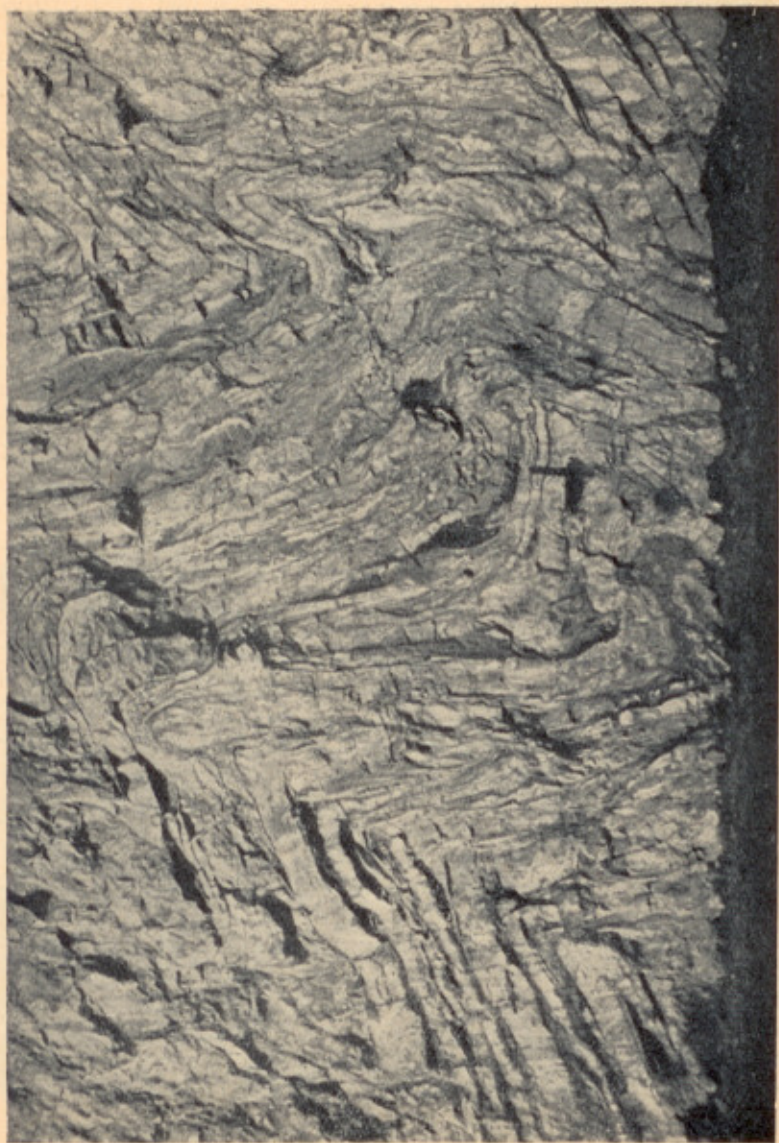
Obr. 2. Zvrásněné lochkovské vápence na Barrandově skále.