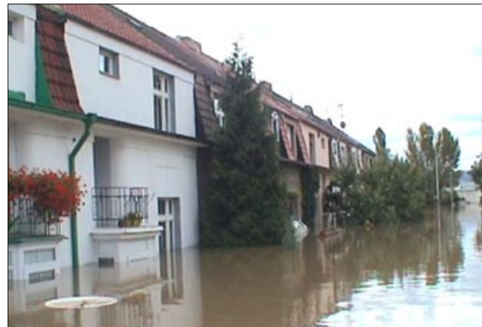
Ulice V Parníku.