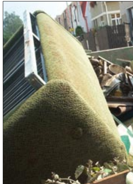
Návrat do vytopených bytů byl neradostný.