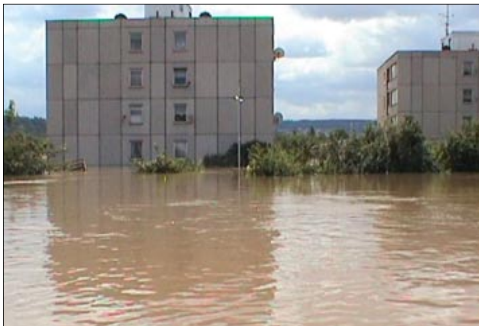
„Statkové domy“ čp. 1329, 1330 na Výpadové ulici.