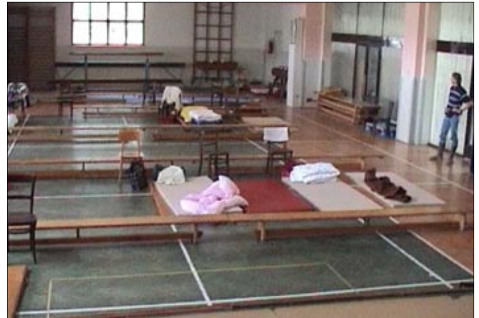
Evakuování obyvatelé byli ubytováni v sokolovně.