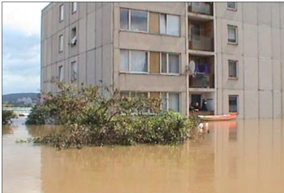
Ulice Výpadová, čp. 1317.