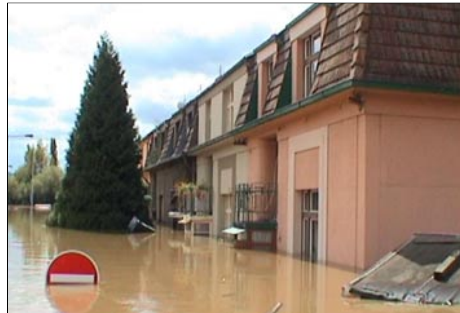
Ulice Na Benátkách.