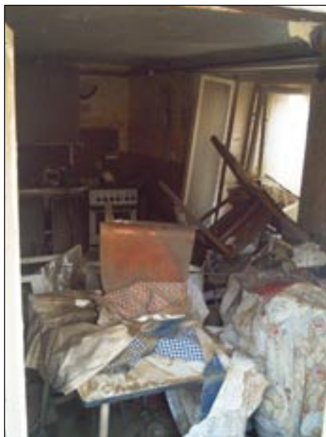
To nejtěžší ještě čekalo.