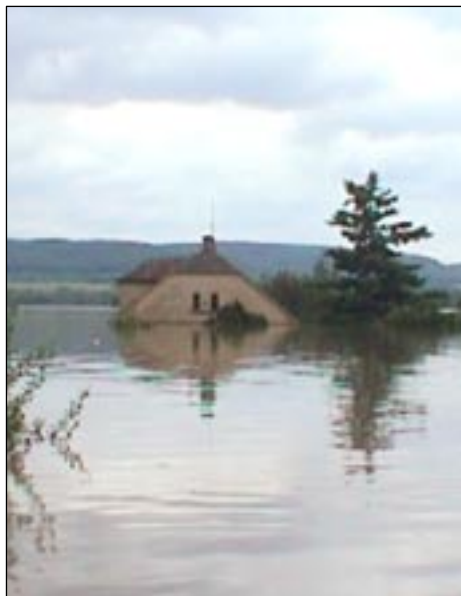
... pro postižené hrůzný zážitek.