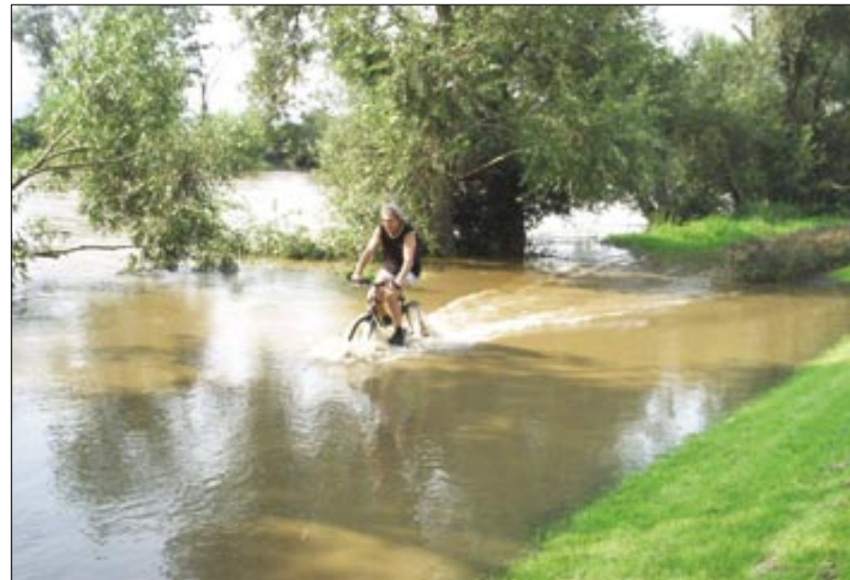
Začátek povodně vypadal nevinně – část cyklostezky pod vodou byla výzvou nejen pro kluky (11. 8.)