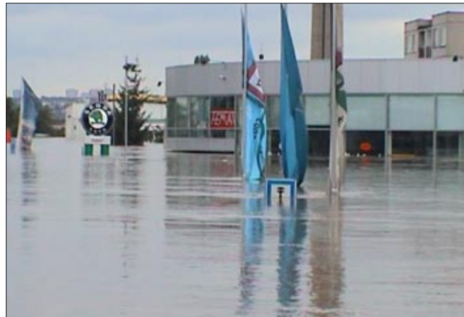
Výpadová ulice – Femat.