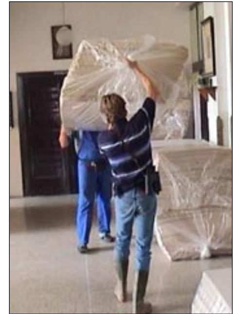
Již za povodně byla organizována humanitární pomoc