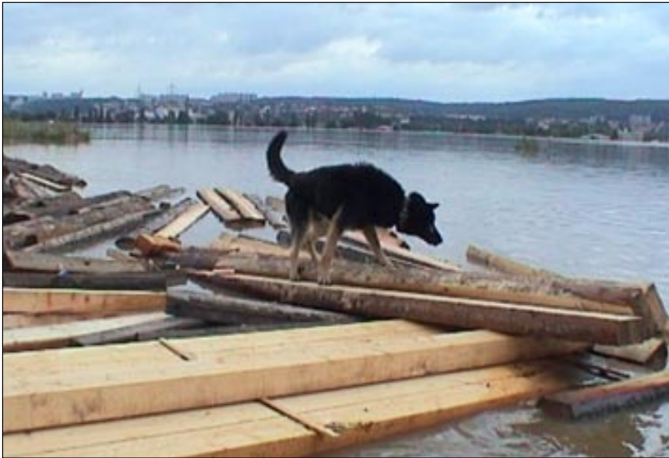
Majetek neochránil ani zámek, ani pes.