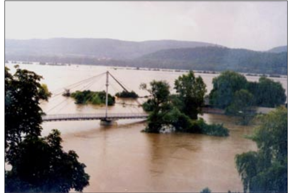
Řeka vytvořila „jezero“ mezi Radotínem a Zbraslaví.