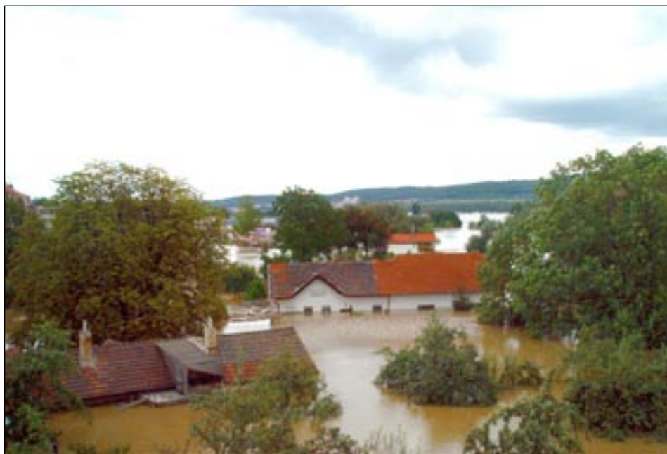
Ulice K Přivozu – mandlovna.