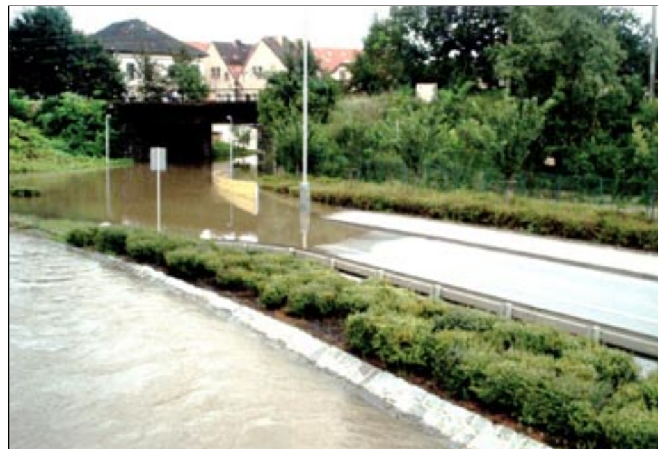
„Soutok“ Berounky a Radotínského potoka u podjezdu.