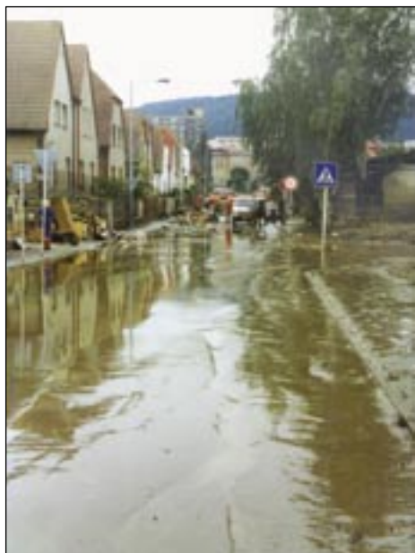
Voda opadla, zůstalo bahno.