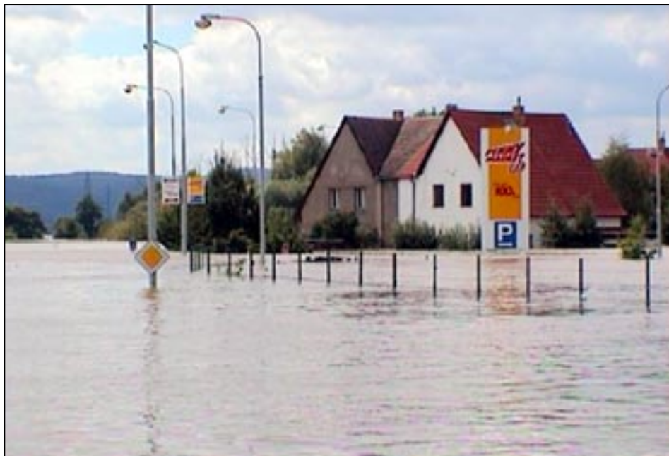
Křižovatka Věštinské ulice s Výpadovou.