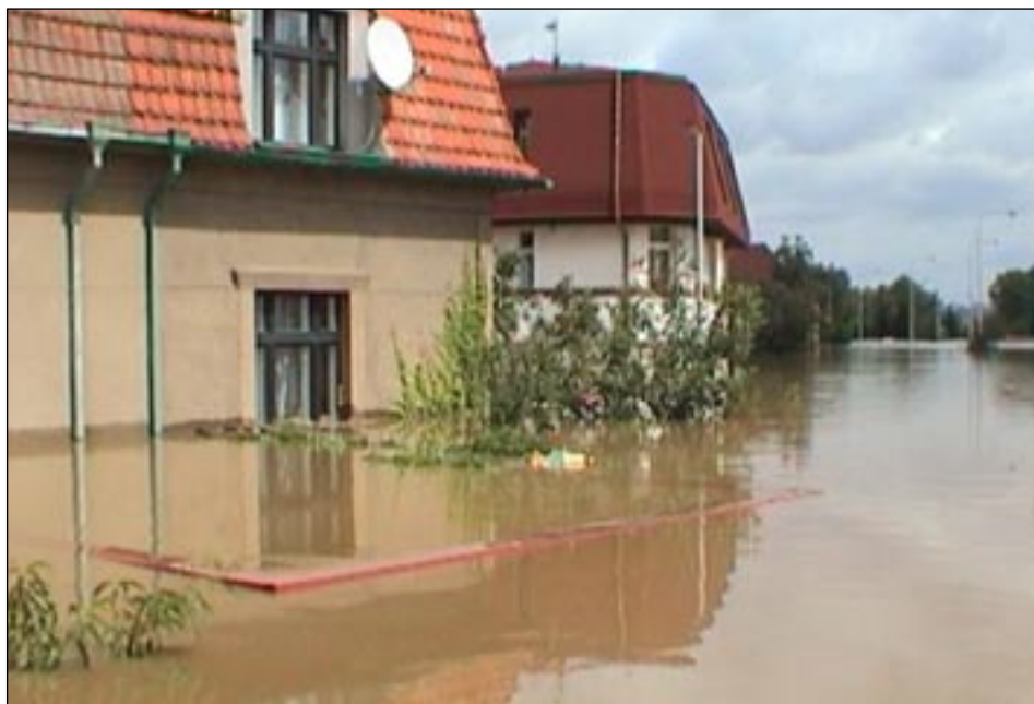
Výpadová ulice v okolí domu s pečovatelskou službou.