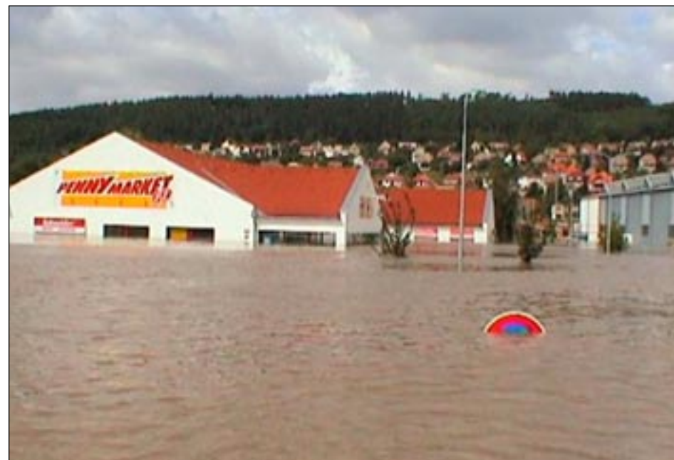
Věštínská ulice – Penny Market.