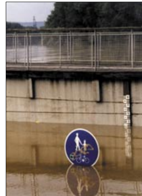
Vodočetná lat na lávce – při normálním průtoku (11. 8.) Tatáž lat při kulminaci (14. 8. 2002)