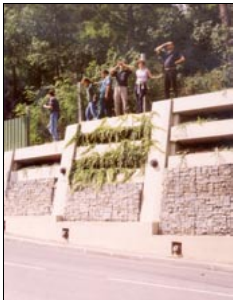
Pro ty šťastnější jen podívaná ...