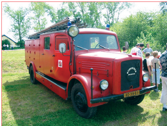
KLÖCKNER AS 16