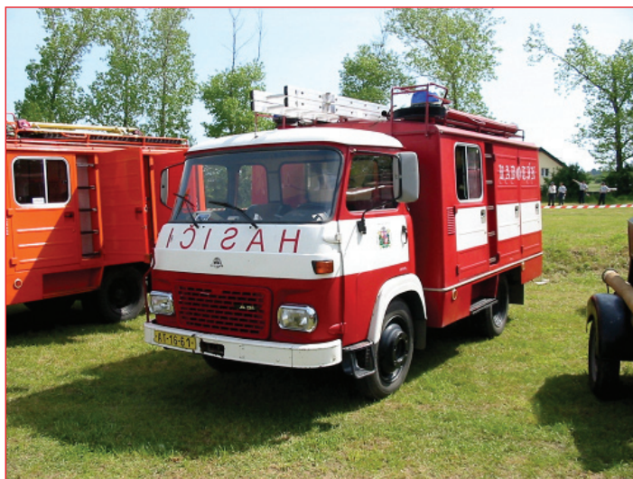
AVIA A31 DVS 12