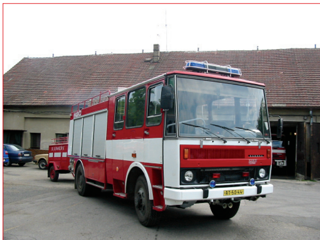
LIAZ K 24