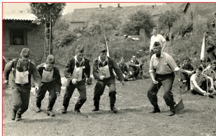
Požární sportovní soutěže jsou tradiční přípravou členů sboru

Ke konci roku 1970 dochází po dohodě mezi základní organizací, MNV a Okresním inspektorátem PO Praha – Západ ke zřízení profesionálního útvaru PO z povolání. Hlavním důvodem souhlasu Sboru byla ta skutečnost, že nechtěl brzdit rozvoj obce Radotín ve výškové zástavbě centra Radotína. Původní záměr sboru byl vybudovat smíšený veřejný požární sbor. Tento záměr se neuskutečnil. Místo toho byl vytvořen samostatný okresní veřejný požární útvar Praha – Západ se sídlem v Radotíně. Nastala tedy symbióza dvou složek PO – placené a dobrovolné – a nutno říct, že radotínští byli vzorem této spolupráce v rámci České republiky. Léta 1971 až 1974 patří po stránce technicko-represivní k neúspěšnějším v historii PS. Vždyť 124 zásahů k požárům, haváriím a k technickým pomocím za rok 1972 výmluvně hovoří za dlouhá slova. K výjezdům společně nastupovali pracovník z povolání společně s příslušníkem dobrovolného sboru a často i u spojaře seděl starší dobrovolný pracovník s příslušnou kvalifikací. V roce 1972 se zakládá - jako samostatná jednotka – družstvo žen, které bylo dvakrát účastníkem národního kola v požárním sportu (v roce 1991 4. místo v ČR).