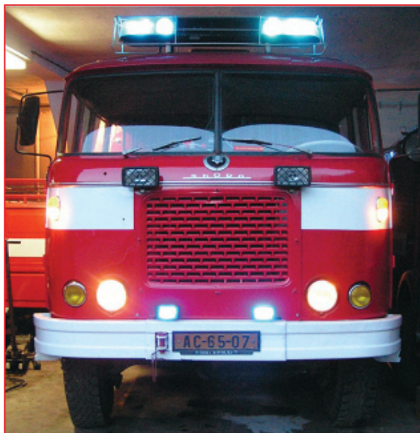
Škoda 706 RTHP CAS 16