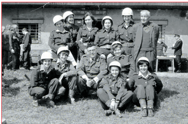
Družstvo žen na soutěži v Lahovicích v roce 1976

Počátkem 80. let organizace prožívala určitou formu stagnace, která však byla vzájemným pochopením překonána. Situace se postupně zlepšovala a poslední měsíce roku 1986 názorně dokázaly, že aktivita na všech úsecích je velmi dobrá. Při